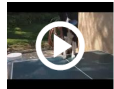
Il cane che gioca a ping pong